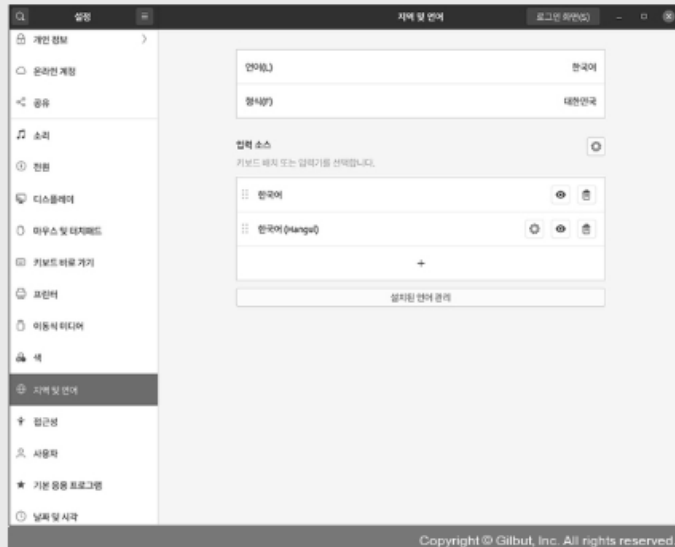
▲ 그림 2-57 언어 패키지 직접 설치

1 GUI는 아래 링크 확인 https://thebook.io/080277/0072/ (NEXT 버튼으로 다음 페이지 확인)